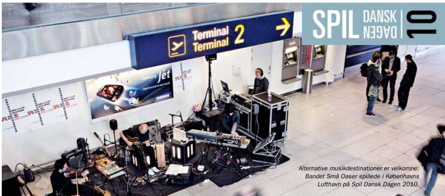
Alternative musikdestinationer er velkomne: Bandet Små Oaser spillede i Københavns Lufthavn på Spil Dansk Dagen 2010.

Der vil være gratis entré alle tre steder, så publikum frit kan gå mellem de koncerter, de gerne vil høre.