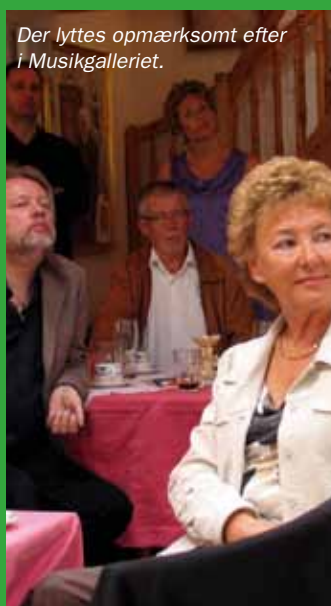
Der lyttes opmærksomt efter i Musikgalleriet.