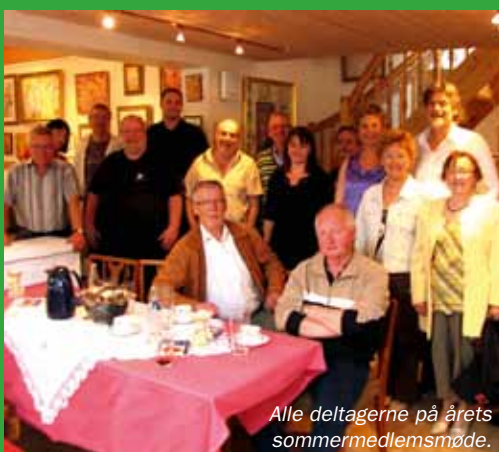
Alle deltagerne på årets sommermedlemsmøde.