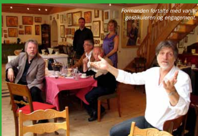
Formanden fortalte med vanlig gestikuleren og engagement.