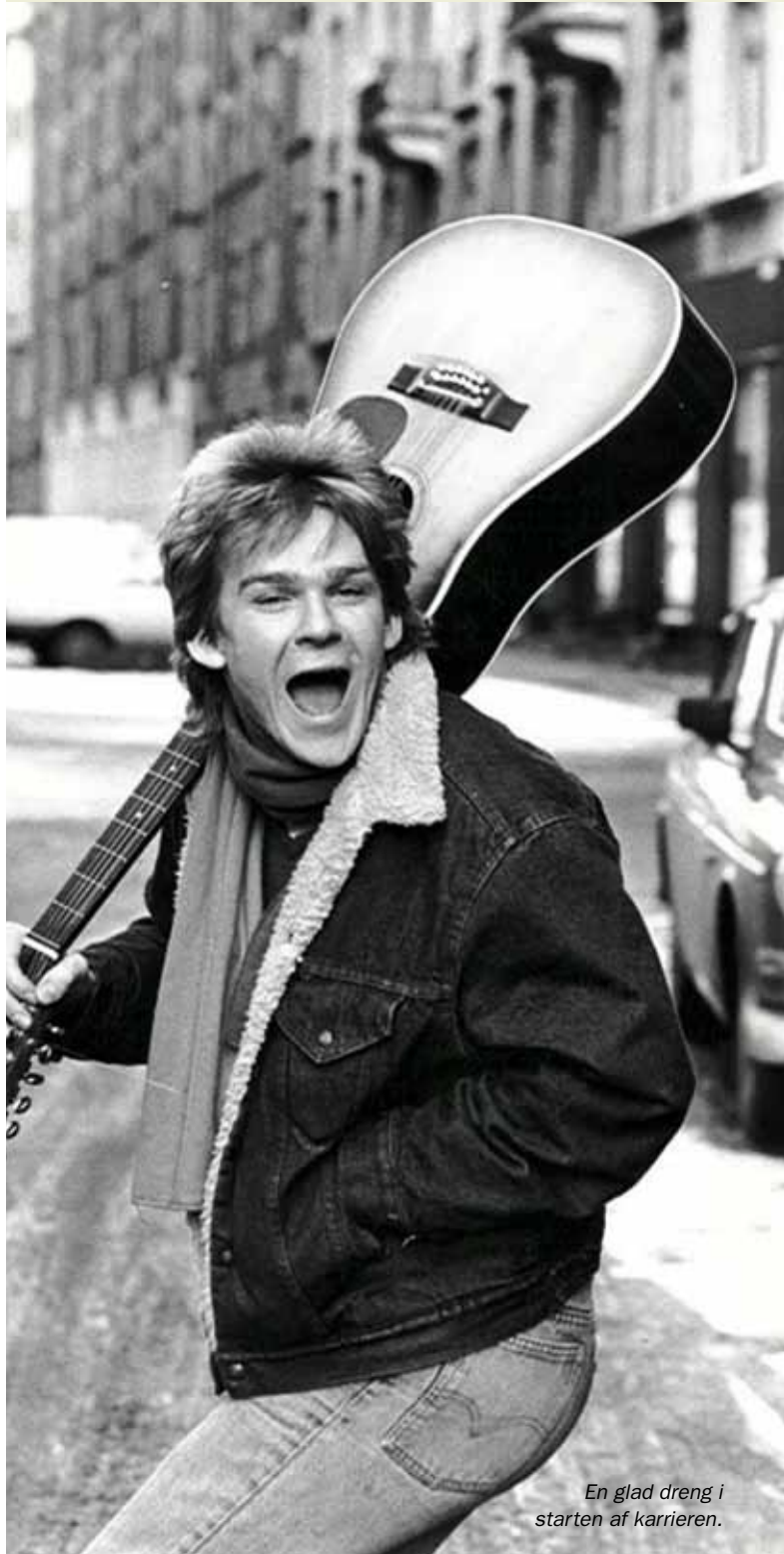
En glad dreng i starten af karrieren.